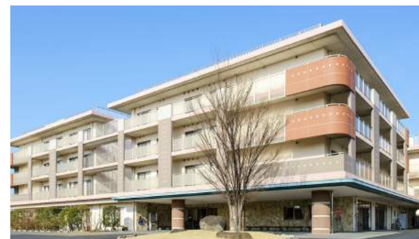
ケアセンター八王子様

印刷を「スピードモード」にすると、たまにこすれる時があるのですが通常通り使う分には、何も問題ありません。小さな事業所なので、コストを考えるとかなり助かります！これからも利用させていただきます。